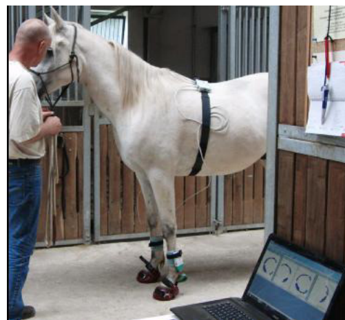
Pferd bereit zur Hufdruckmessung